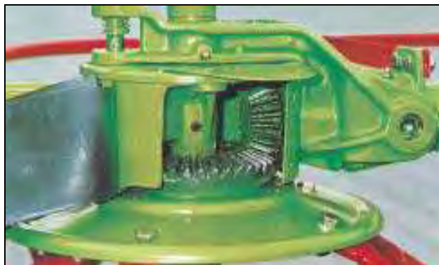
Figura 2. Ejemplo de sistema de engranaje

Punto de engranaje: Zona en las que dos o más piezas entran en contacto, estando al menos una de ellas en movimiento (Figura 2).