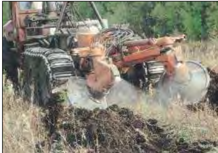
Figura 6. Ejemplo de proyecciones a alta velocidad

Los accidentes agrícolas más frecuentes asociados a proyecciones son los siguientes: