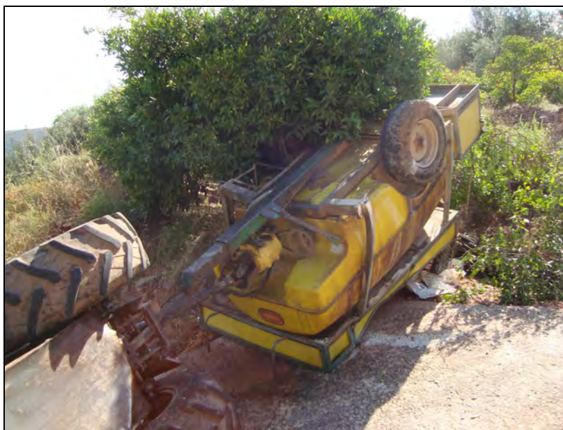
Figura 3.- Vuelco de tractor

Las consecuencias del aplastamiento por vuelco de un tractor sin cabina de seguridad homologada suele ser la muerte del tractorista o lesiones muy graves. La mejor manera de protegerse es con el uso conjunto de estructura y cinturón de seguridad. Todos los tractores nuevos de más de 800 kilos deben disponer de estructura de seguridad homologada. Tan peligrosos como los tractores sin cabina o bastidor, son aquellos que poseen una para la protección de la intemperie, cuyas características estructurales son totalmente insuficientes para proteger al conductor en caso de vuelco. Es preciso instalar un modelo homologado de cabina o bastidor.