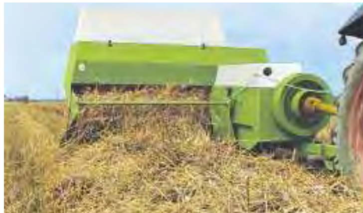
Figura 5. Empacadora