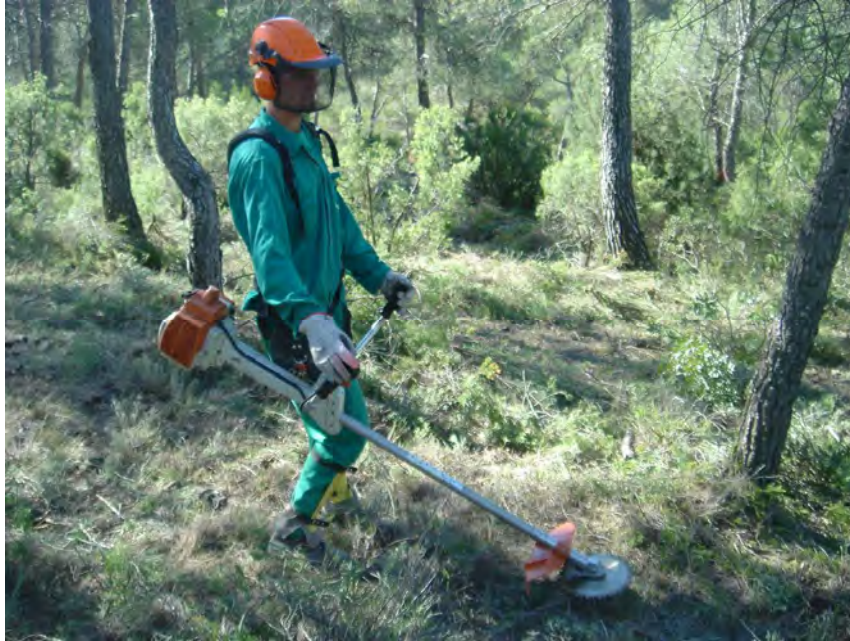
Figura 7. Desbrozadora manual