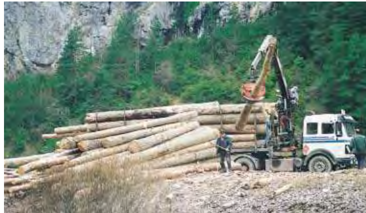
Figura 4.- Carga de madera sobre la caja de un camión forestal

Son varias las causas principales que determinan el vuelco de un tractor, ya sea lateral o hacia atrás ("encabritamiento") o bien van a influir en la gravedad de las consecuencias a sufrir por el tractorista accidentado. Estas causas (Cuadro 1) se pueden agrupar en los siguientes grupos: