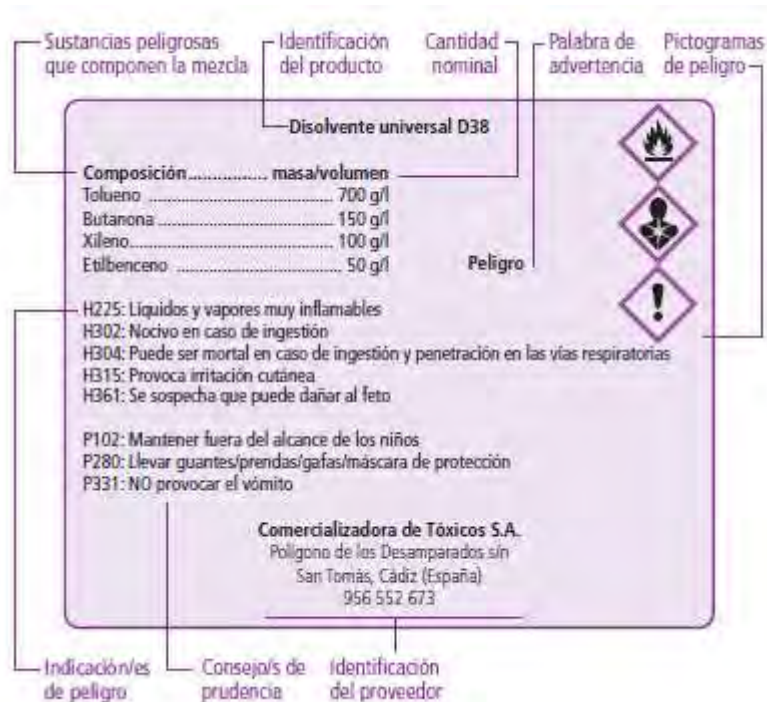
Gráfico 1.- Ejemplo de etiqueta